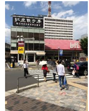
「LOFT」側の通路へ渡り右折 100mほど直進します。