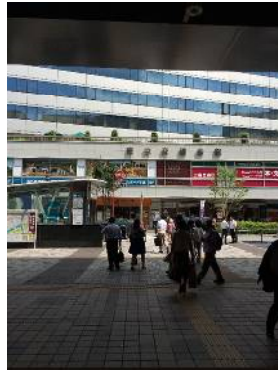
改札右側前方の「東京交通会館」 に向かって直進します。