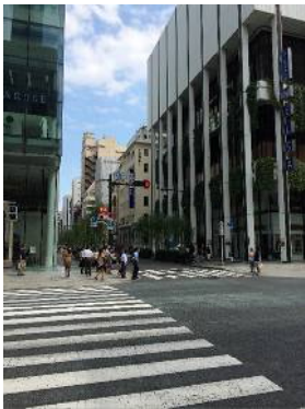
「銀座一丁目」（中央通り）の信号を 渡り、さらに300mほど直進します。