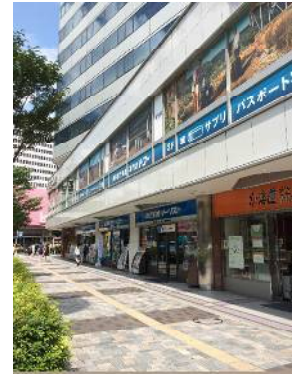
「東京交通会館」を右手に見ながら 100mほど直進します。