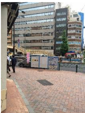
突き当りの大通り(昭和通り)を 左折し100mほど直進します。