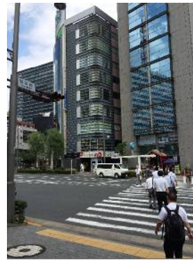
「有楽橋」（外堀通り）の信号を渡り そのまま300mほど直進します。