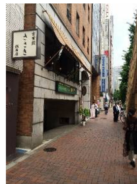
インド・ネパール料理「Khyber」 (カイバル)が入店する レンガ調の建物の 3Fが当社事務所です。