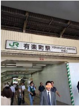
京橋口（東京駅側の出口）が 最寄りの出口になります。